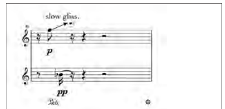
Kieselsteinartiges | Klavier, Takt 17 (Wiedergolungen im dritten Teil)

allerdings, die nicht nörgelt und griesgrämig daherkommt, sondern eher eine «lustvolle Melancholie» ist, wie Robert Burton sie vielleicht beschreiben würde: «Aber, es ist eine lustvolle Melancholie, die so entsteht; und deshalb ist sie [die Musik] für den Menschen im Zustand von Unzufriedenheit, Schmerz, Angst, Sorge oder Nieder geschlagenheit ein sehr probates Heilmittel: es vertreibt den Kummer, wandelt den betäubten Geist und hilft im Augenblick.» 2 ■